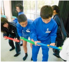
ピアサポート研修