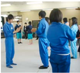
ピア・サポート研修

ピア・サポートホームは、1年次生から3年次生まで混在する、学年の枠を越えたホームルーム編成のことです。自分のことばかりではなく、ピア（仲間）もサポートすることのできる生徒の育成をねらっています。