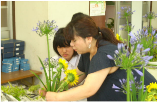
アドバイスを受けている3年生