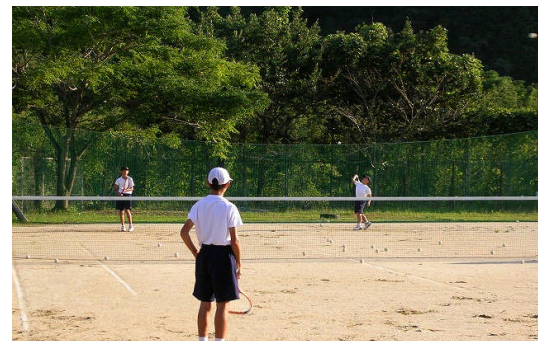
テニス部練習風景

だったそうです。今後に大きな期待をもつことができるところを示した大会になりました。