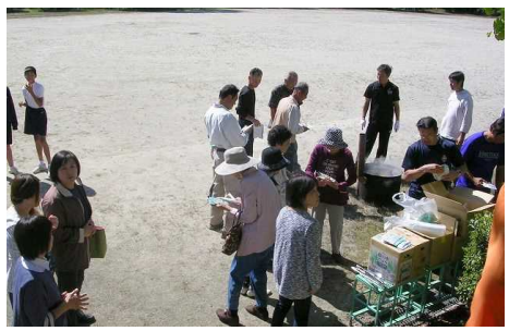
炊き出し訓練の様子