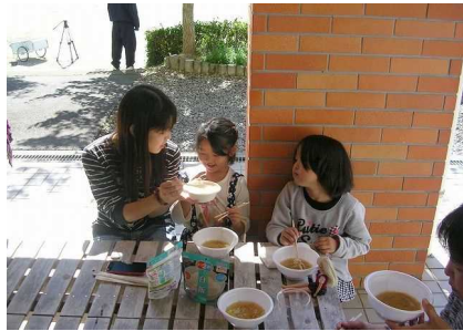
小学生も保護者と参加してくれました