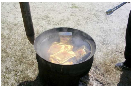
元 澤近校長先生のかま