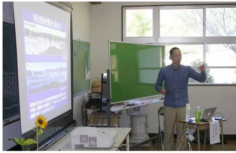
防災教育 講演の様子

橋上地域の地形を示しながら、わかりやすい講演をしていただきました。橋上地域は火山地帯のような硬い岩石でできていますが、大規模な崩壊の危険性があることなど教えていただきました。←