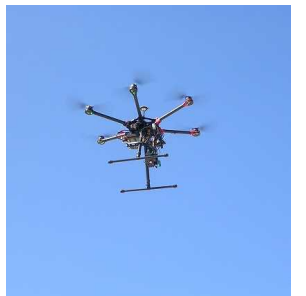
空撮しているドローン

本日に、ありがとうございました。また、昼食には非常食のほかに、教職員が豚汁を作る計画をしていますが、配膳に忙しくなると、保護者の方が自然と手を貸してくれるなど、大変、助かりました。