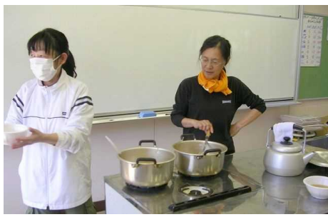
朝から豚汁作り 保護者も一緒に