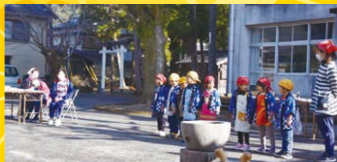
もちつき交流会(地域・保・中)