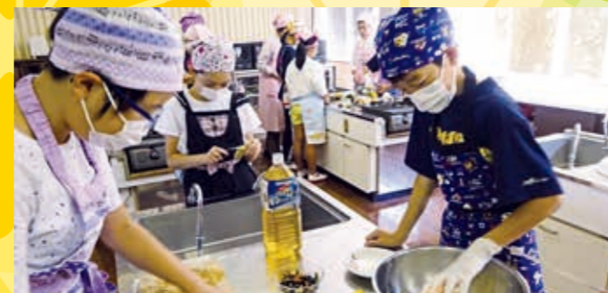
地域の方との調理実習(地域・小)