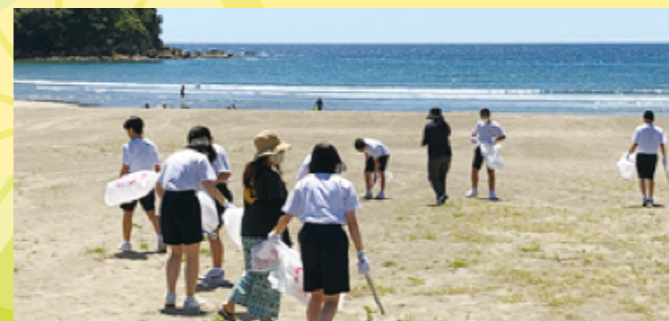
白浜海水浴場清掃(中)