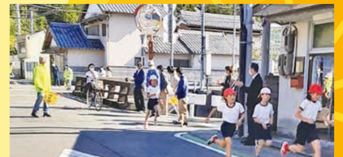
持久走・マラソン大会(地域・小・中)