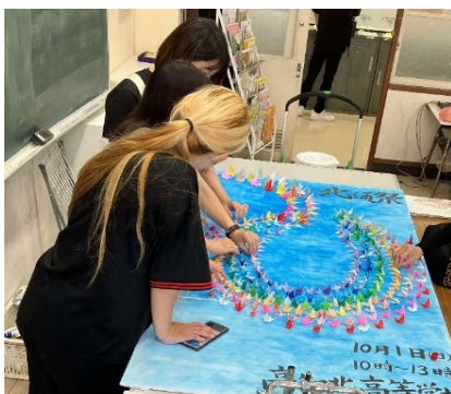
【生徒・教員数の折り鶴看板】