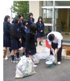
清掃ボランティア