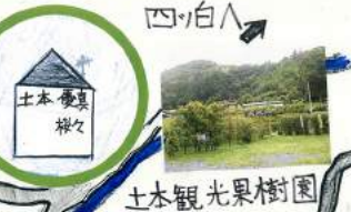
土本 慶真 様々 土本観光果樹園