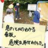
危いものわかる看板。危険な所はわかる。