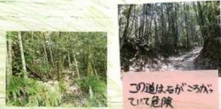
この道は石がころがっていて危険