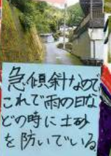
急傾斜なぬここれで雨の日にこの時に土砂を防いでいる