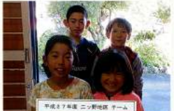
平成27年度 ニッ野地区 マップ