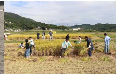
10 / 7 (水) 稲刈り