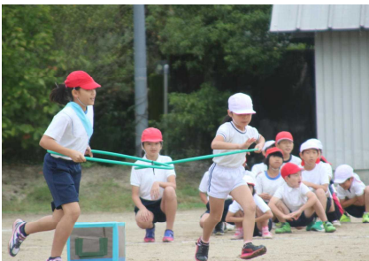
10 / 18 (日) 運動会