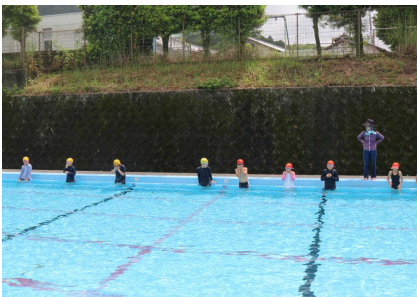
6 / 12 (金) プール開き