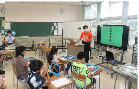
7 / 7 (火) ロボット動物園