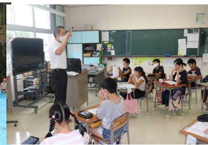
6 / 30 (火) 町長特別授業