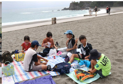
9 / 25 (金) 社会科見学