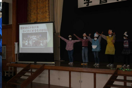
2 / 20 (土) 学習発表会