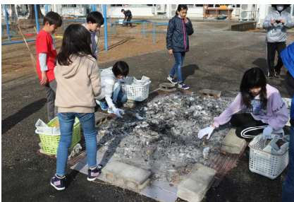
1 / 16 (土) 焼き芋