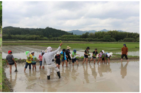
6 / 9 (火) 田植え