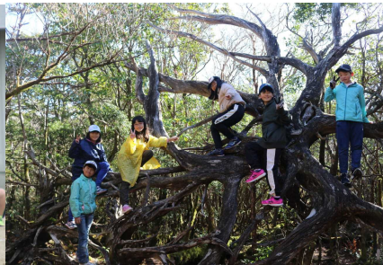
11 / 20 ~ 21 宿泊学習