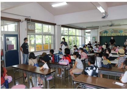
8 / 2 (日) PTA親子行事