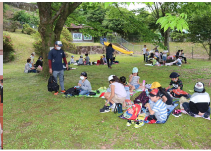
5 / 22 (金) 遠足