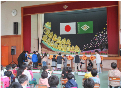
4 / 7 (火) 入学式