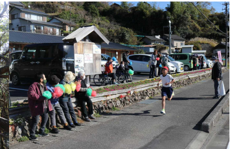
12 / 3 (木) 持久走大会