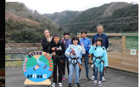
3 / 4 ~ 5 修学旅行