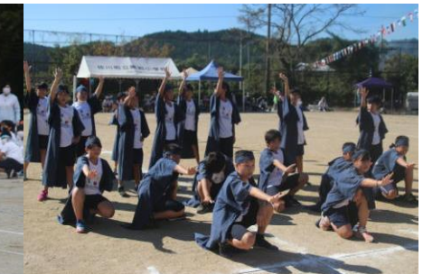
10 / 15 (土) 運動会