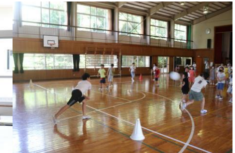
7 / 13 (水) 全校遊び