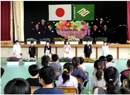
4 / 7 (木) 入学式