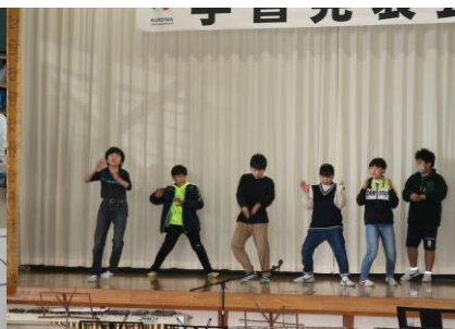
2 / 11 (土) 学習発表会