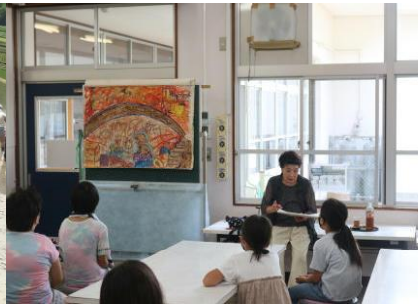
7 / 6 (水) 平和集会