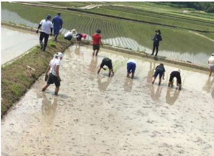
6 / 10 (金) 田植え