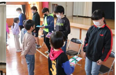
3 / 1 (水) 六年生を送る会