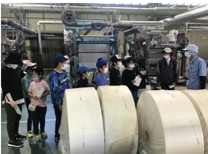
10 / 21 (金) 社会科見学