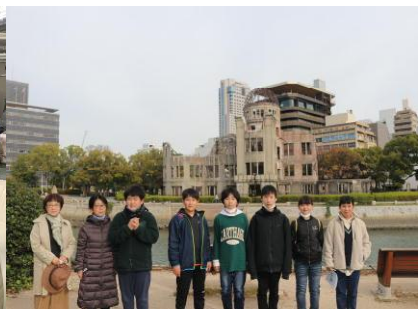
12 / 7 (水) ~ 9 修学旅行