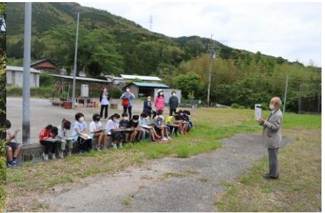
5 / 10 (火) 黒岩城学習