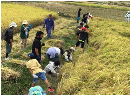
10 / 6 (木) 稲刈り