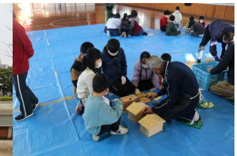
12 / 20 (火) 巣箱作り