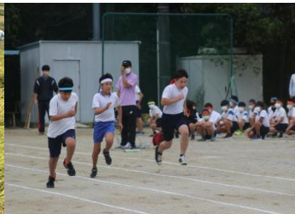
10 / 12 (水) 陸上記録会