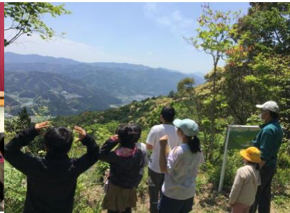
5 / 2 (火) 遠足