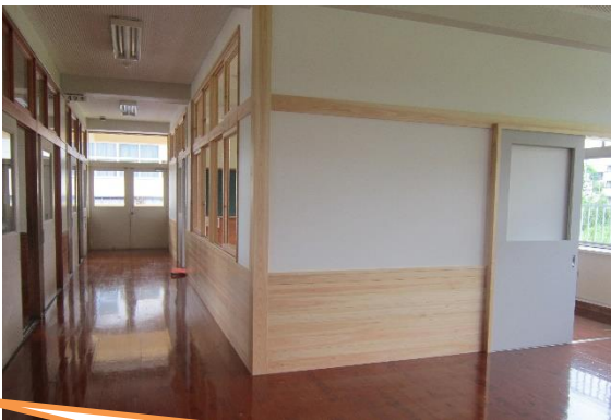
4 年生教室北側のワークスペースに間仕切り、新しく教室を確保しました。

さて、毎年のことですが、長期休業の後はそれまでの家庭の生活のリズムから学校の生活のリズムに戻すことに時間がかかったりします。また、生活リズムのずれから体調を崩したりすることもあります。どうぞお子様の様子にご配慮いただき、円滑に学校生活が始まりますようご協力いただければ幸いです。