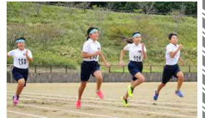
【ほぼ横一線でスタート】