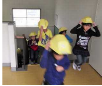
【真剣に取り組みました】

23日(火)は、防災の授業後、地震・津波対応の避難訓練として、大谷保育所まで一時避難する予定でしたが、天候不良等のため校舎3階に避難することになりました。1学期も雨天のため、校舎内避難となりましたので、大谷保育所への避難訓練を年度内に実施する方向で検討していきます。