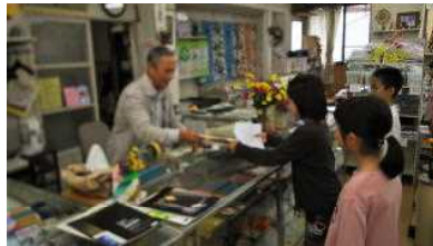
【よろしくお願いします】

4年生は、9地区に分かれてお店を一軒一軒訪問し、あいさつ運動の説明をしながら、標語の掲示をお願いして回りました。訪問先の皆様、ご協力ありがとうございました。今後も、気持ちのよいあいさつあふれる室戸市にしていきたいと思います。