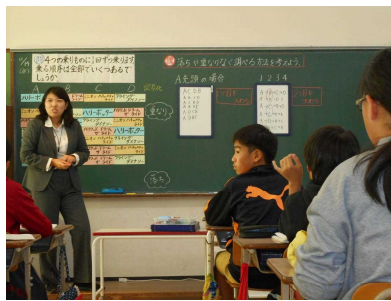
【6年「並べ方と組み合わせ方の授業】