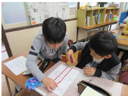
友だちと図形の勉強