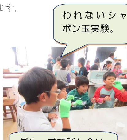
グループで話し合い