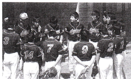
男子ソフトボール部 池川中・吾川中合同チーム

たとえられる部活動ですので、何とか解決できないものかと、そんな思いに駆られます。