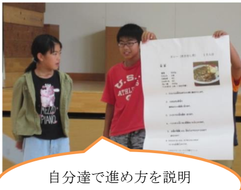
自分達で進め方を説明します。

炊き出し訓練はカレー作り。これまでの防災キャンプの経験を活かし、材料は防災クイズに正解した班にのみ与えられるサバイバル形式で行うことになりました。6年生は防災クイズを考え、進行の計画を作り、材料や道具などは益先生に協力してもらいながら準備を進めてくれました。カレー作りは保護者の方やヘルスマイトの皆さんのご協力も頂きました。