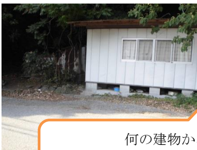
何の建物かな？ かべや草があって見通しが悪いな。

各地区で危険・安全について話し合いをするなら、資料はどうするか？この？（はてな）に対しては地域の写真が必要だということになり、上級生が自分達の地域の写真を自分達で撮ってくる事になりました。その活動に先立ち、上級生は身の周りの危険について学習を行いました。普段の自分達の生活では考えてこなかった事例もあり、みんなで新しい発見をしながら学習をしました。