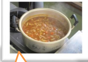
無事材料もゲットできて、おいしいカレーが完成！