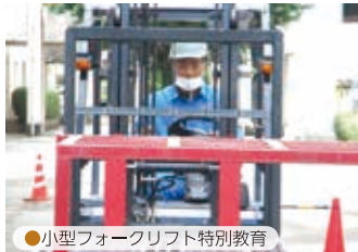
●小型フォークリフト特別教育