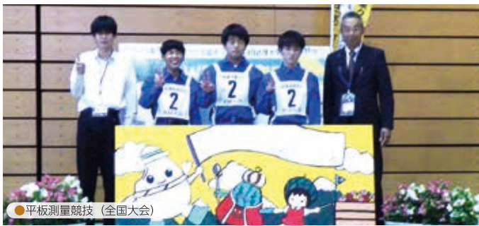
●平板測量競技（全国大会）