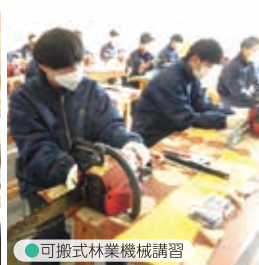
● 可搬式林業機械講習