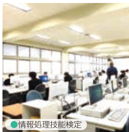
● 情報処理技能検定

⑤ その他進路実現に向けた対策や、チェーンソー・大型重機の資格取得に取り組んでいます。