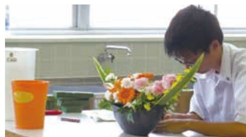
フラワーアレンジメント競技