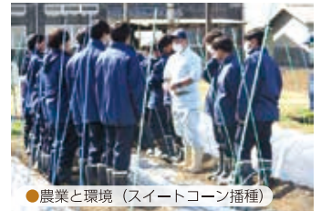
●農業と環境（スイートコーン播種）