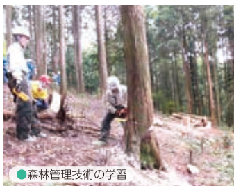
● 森林管理技術の学習