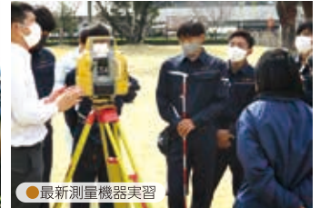
●最新測量機器実習