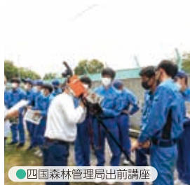
● 四国森林管理局出前講座