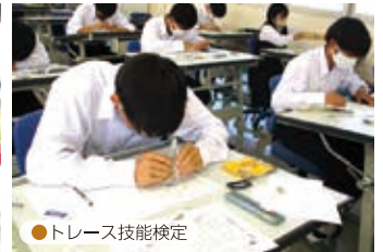
●トレース技能検定