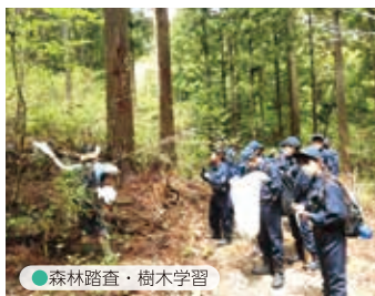
● 森林踏査・樹木学習