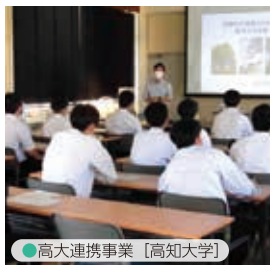
● 高大連携事業【高知大学】

⑤ その他進路実現に向けた対策や、チェーンソー・大型重機の資格取得に取り組んでいます。