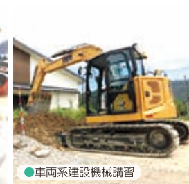
● 車両系建設機械講習