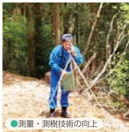
● 測量・測樹技術の向上