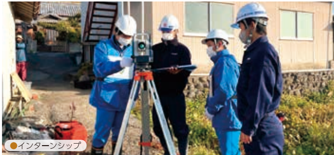
●インターンシップ