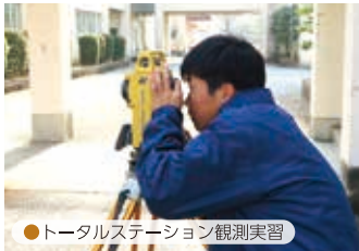
●トータルステーション観測実習