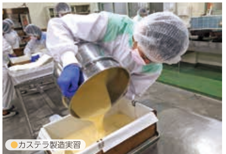
●カステラ製造実習