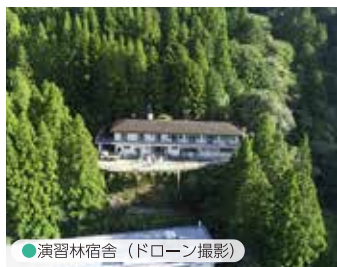
● 演習林宿舎（ドローン撮影）

① 演習林実習では125ヘクタールの森林を活用して測量技術や森林管理技術を学び、宿泊を通してクラスメートとの協調性を養います。