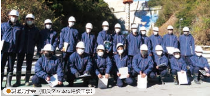
●現場見学会（和食ダム本体建設工事）

2年次から「A 土木専門コース」と「B 進学コース」の2つのコースに分かれて学習します。