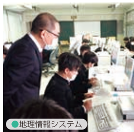
● 地理情報システム