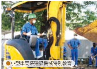
●小型車両系建設機械特別教育