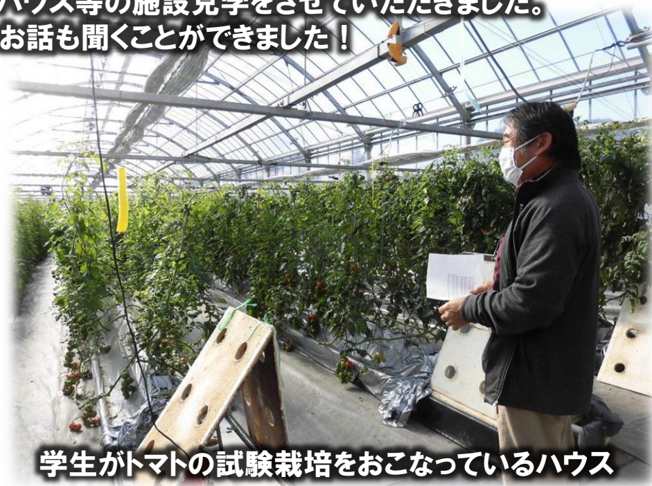
学生がトマトの試験栽培をおこなっているハウス