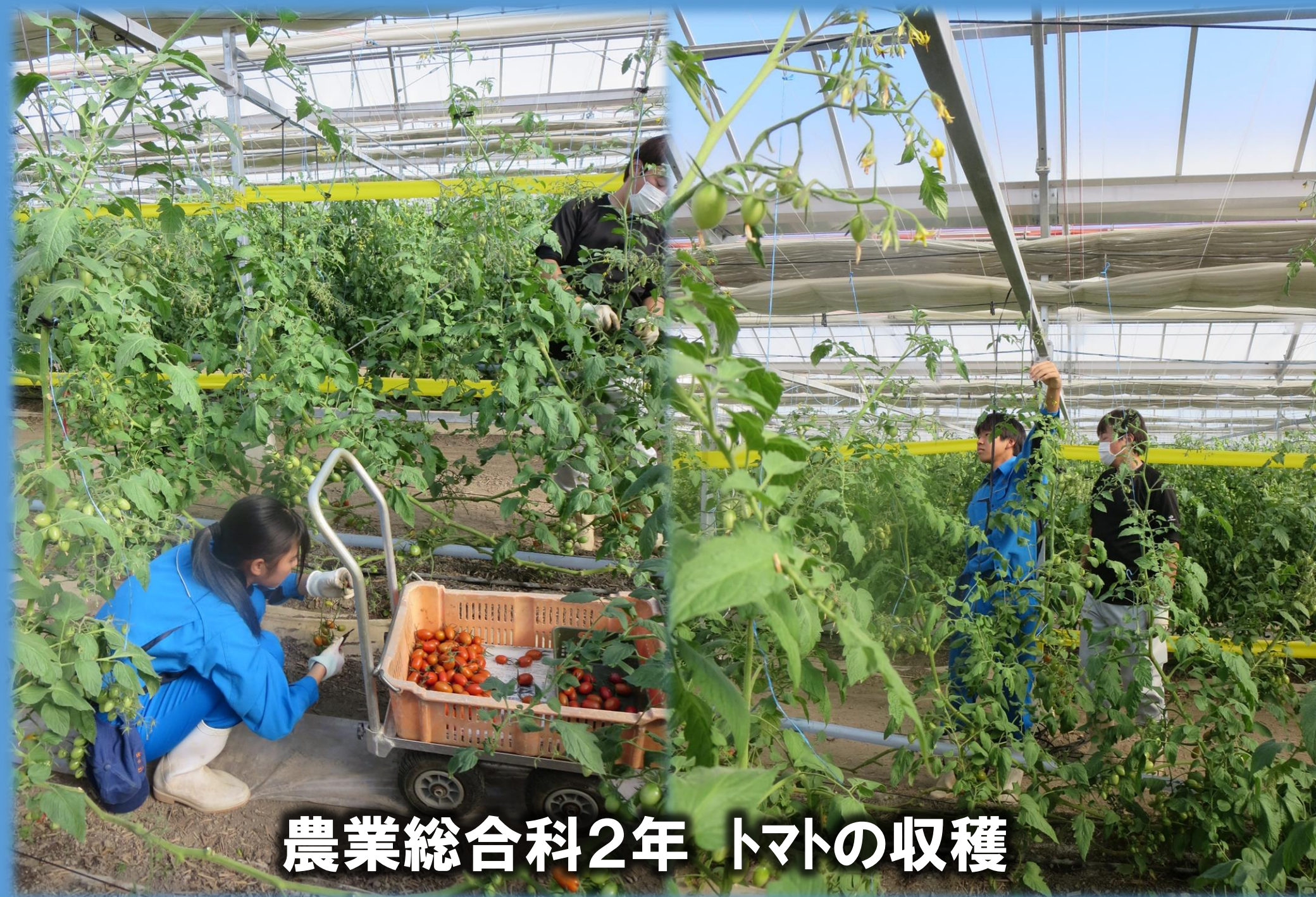
農業総合科2年 トマトの収穫