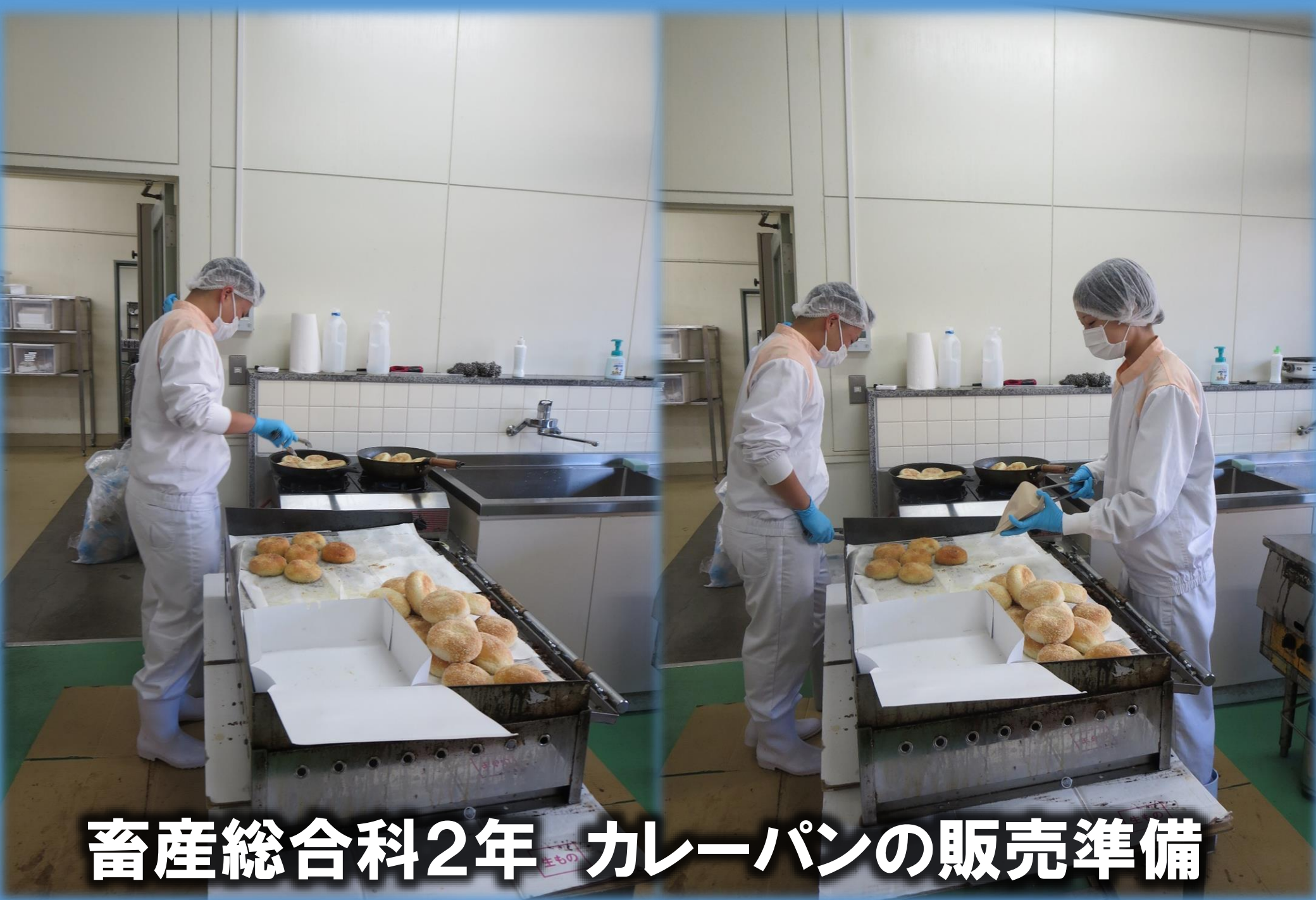
畜産総合科2年 生もの カレーパンの販売準備