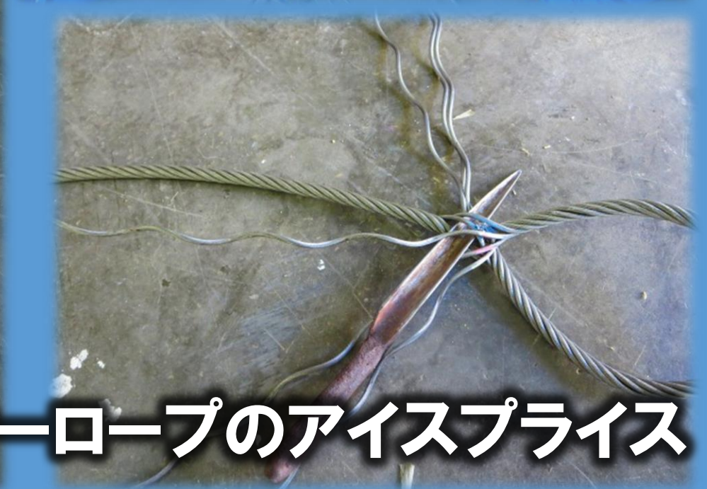
森林総合科2年 ワイヤーロープのアイスプライス