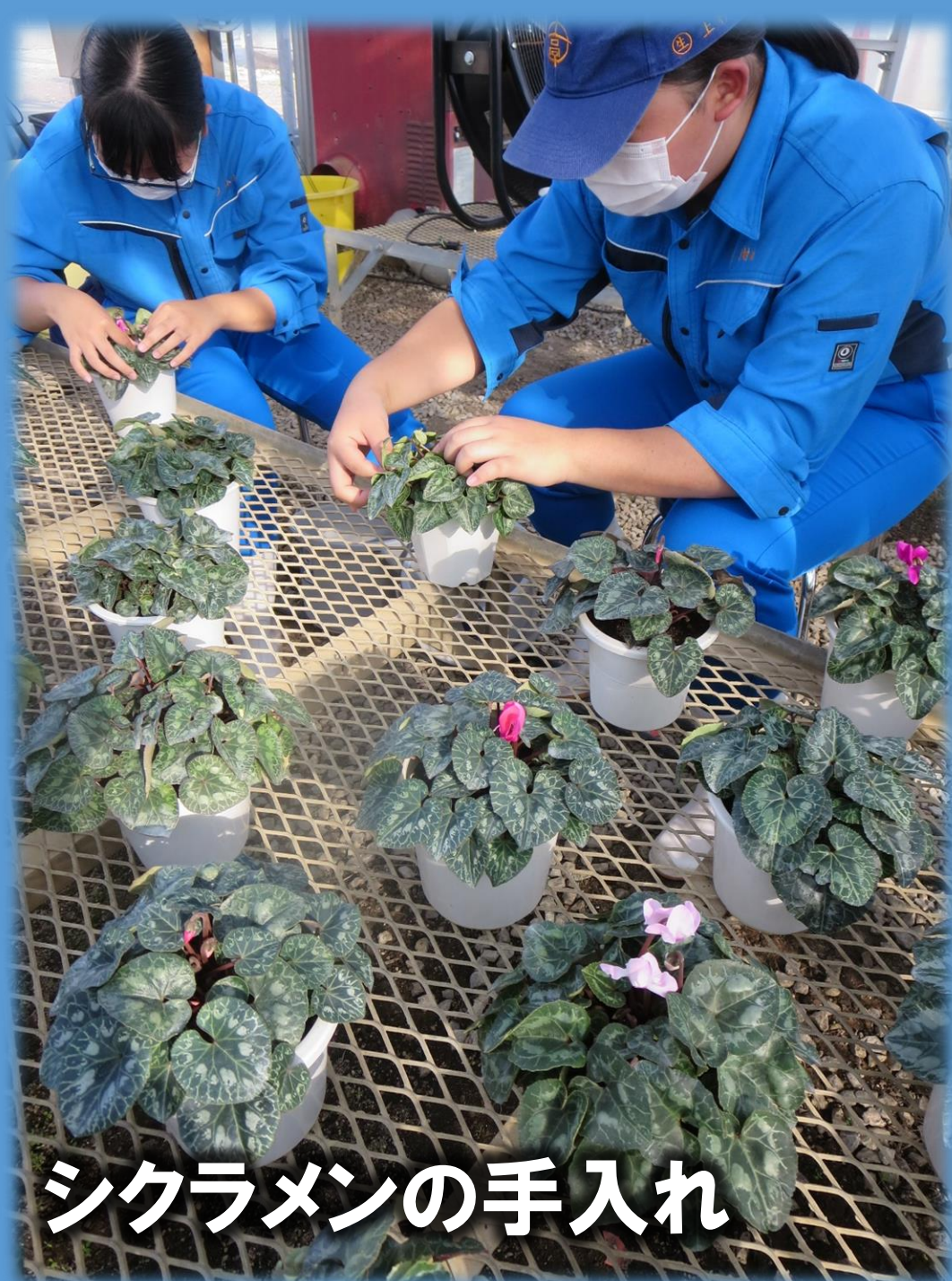
農業総合科2年 シクラメンの手入れ