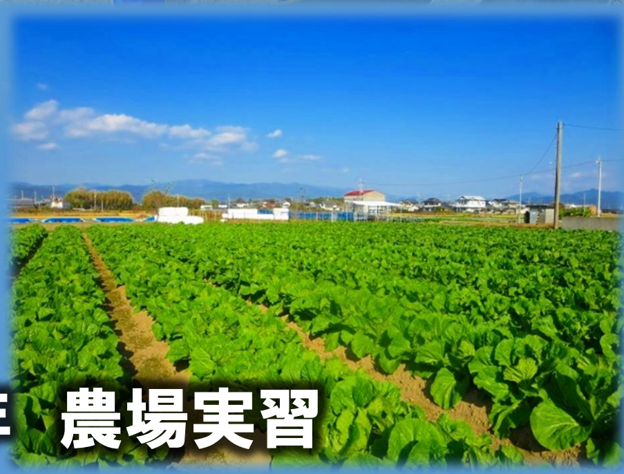
生活総合科2年 農場実習