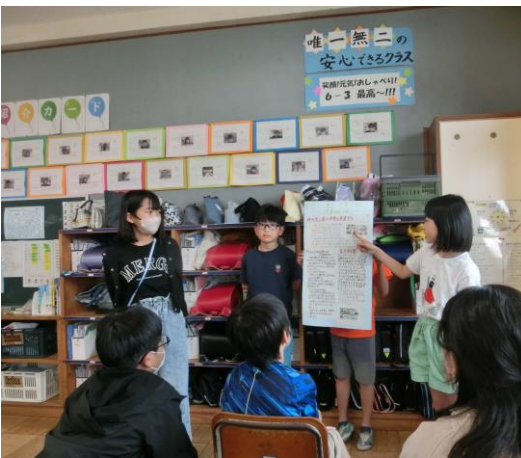
5年生・6年生の授業の様子

また授業後には、全校での引き渡し訓練を行いました。子どもだけで帰宅困難な場合を想定し、連絡システム「すぐーる」で保護者の皆様に連絡し、安全・確実に児童を引き渡す手順について、実際に行いながら、確認をさせていただきました。全校での実施は数年ぶりの訓練でしたが、保護者の皆様のご協力により、混乱もなく速やかに実施することが出来ました。実際には、なかなか今回のようにスムーズにはいかないかもしれませんが、様々な事態を想定しながら、こうした訓練を繰り返し行うことで、学校として危機意識をもって備えたいと考えています。お気づきの点がありましたら、お聞かせいただけると幸いです。どうぞよろしくお願いいたします。(※「すぐーる」には、1家族5名まで登録できます。万一のことを想定し、ぜひご家族皆さんでの登録をお願いいたします。)