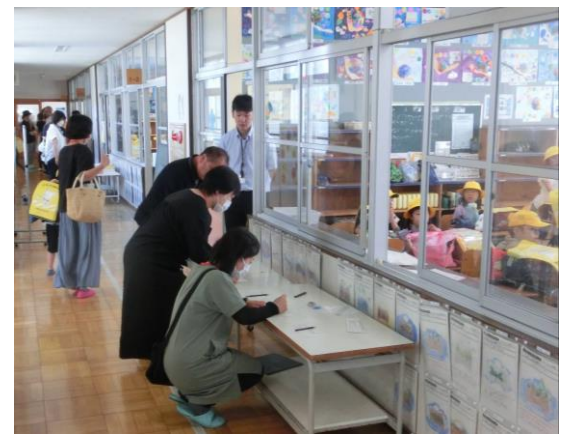
引き渡し訓練の様子