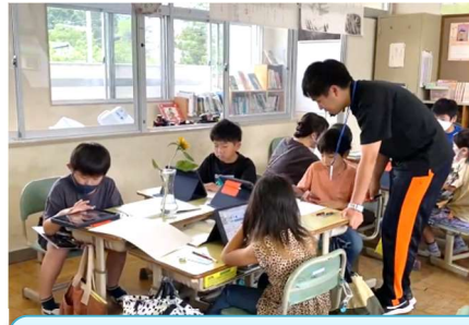
【2・3年生】国語で調べたことをロイロノートというアプリでまとめています。写真をそのまま挿入できるので、やる気があがります！辞書もしっかり使っています！