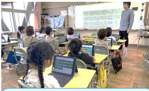
【1年生】生活科でアサガオの写真をアップし、「友達の写真が見えた～」と大はしゃぎ。来週から持ち帰りを始める予定です。

これまでの学校での学びは、どちらかというと黒板しかない時代の学びをずっと続けてきました。皆が一斉に前を向き、先生の話聞く、そんな授業が中心でした。しかし、タブレットを活用すると、授業で「挙手・指名・発表」と時間をとっていたことが、チャット機能を使うことで、多くの子どもたちの意見を瞬時に出し合うことができます。教員も困っている内容や児童に対して、ヒントや支援の情報をすぐに送ったり、声をかけたりすることができます。一斉授業では、分かりにくかった一人一人の学びにもアプローチをかけることができますようになります。そして、子どもも、先生もワクワクするような発見や学びに気づかれます。そんな令和の授業づくりを子ども達と一緒に進めていきたいと思えます。