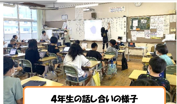
4年生の話し合いの様子