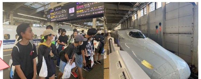
新幹線！あっという間に新神戸！