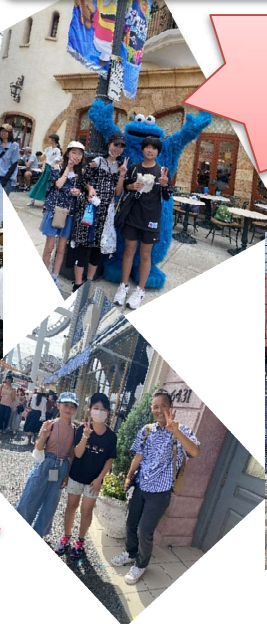
USJ 最高に楽しかった!!