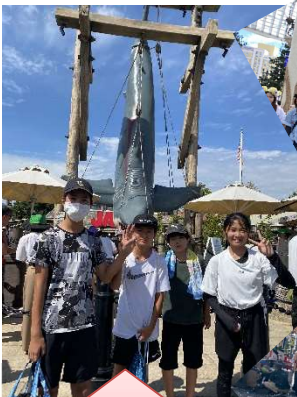
素敵な笑顔と、思い出ができました。