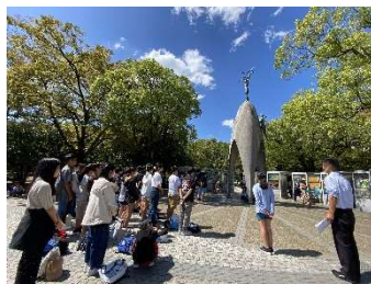
青空の広島平和公園。原爆ドーム、資料館、語り部さんのお話。真剣な6年生の表情でした。