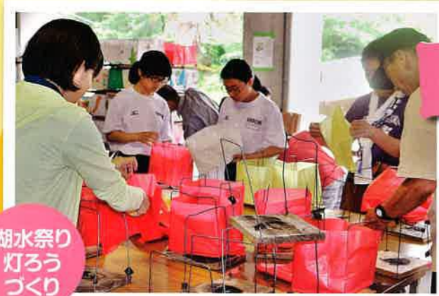
湖水祭り 灯ろう づくり