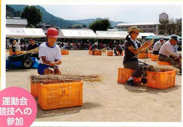
運動会 競技への 参加