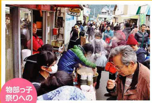
物部っ子 祭りへの 出店