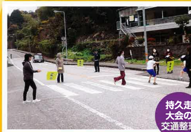
持久走 大会の 交通整理

地域の中で育てられているという安心感が、子どもたちの健やかな成長につながっています。