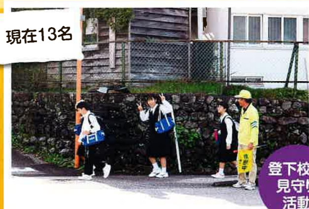
登下校の 見守り 活動

地域の中で育てられているという安心感が、子どもたちの健やかな成長につながっています。