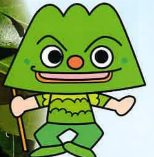
さんれいさんちゃん ©やなせたかし