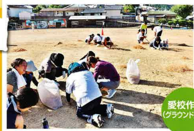
愛校作業 (グラウンド整備)