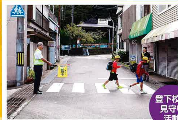
登下校の 見守り 活動