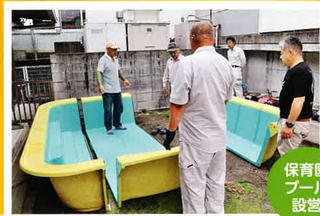
保育園 プール 設営