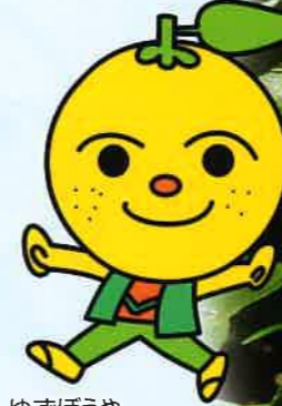
ゆずぼうや ©やなせたかし