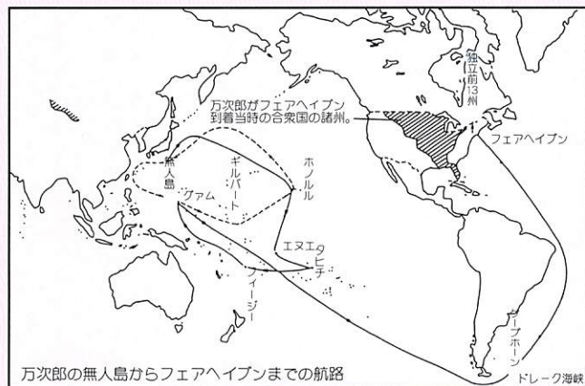
万次郎の無人島からフェアヘイブンまでの航路