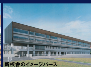
新校舎のイメージパース