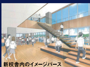
新校舎内のイメージパース

令和6年度中に校舎を市内清水ヶ丘に移転します。新校舎は海拔40mの高台にあり、安心して学べる校舎になります。