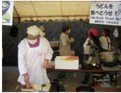
PTA もおいし～うどんを販売