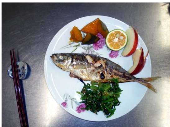
出来上がりました・・・