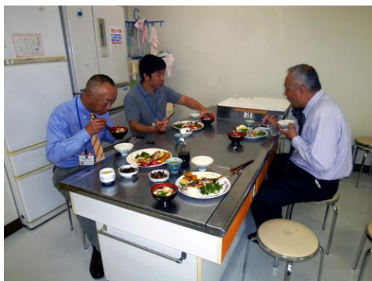
教育長 & 教育次長 & 課長補佐 「美味しい！」とお褒めの言を・・・