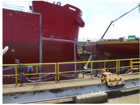
大型船が建造中（写真に入りきれません）