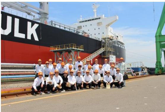
試運転前の船を背景に