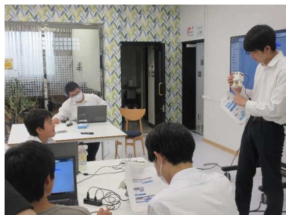
プログラミングの説明