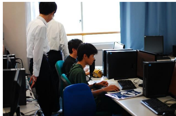
ロボットの設計をしている様子