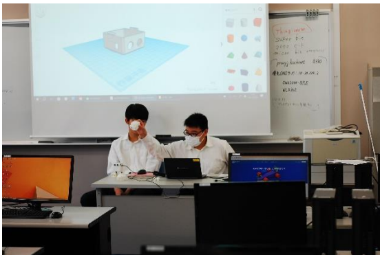
ロボットの設計の説明

機械制御専攻1・2年生で、「てくテックすさき」と連携してロボット子ども教室を開催しました。ロボットの設計・工作からプログラミングまでを行い、参加者の子どもたちは、試行錯誤を繰り返し、楽しみながら自作ロボットを製作しました。高校生たちの積極的に子どもたちに教えている姿が見られ、大変有意義な時間を過ごすことができました。