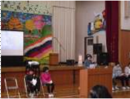
(発表を頑張る一年生……)

で学べる残り登校日数は、なんと36日間……本年度も秒読み段階に入ってしまった。57名の児童が、日々切磋琢磨を繰り返す中、学力を付け楽しい思い出を積み重ねていって欲しいと考えます。皆様におかれましては、新年に入