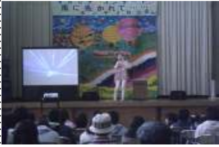
(ホンヤミカコさんのコンサート)

一月が「いで」しまい早くも2月が始まりました。子ども達にとって卒業・修了式までの日数は51日間。6年生にとって小学校