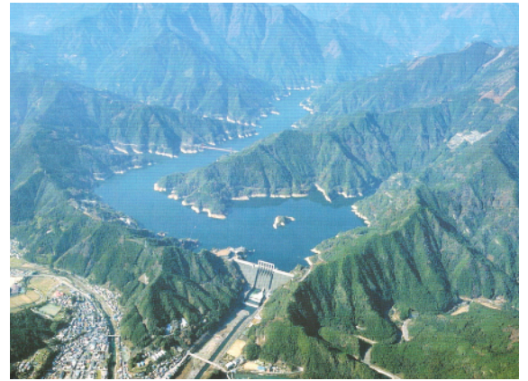
「四国のいのち」さめうら湖

そこで、体験活動を通して希薄になりがちな人間関係(親子関係、友達関係)を深化させるとともに、子どもたちの感受性、表現力、豊かな心を育てるとともに、土佐町の豊かな自然を体験しふるさとを大切に思うところを育てることを目的として本事業を実施します。