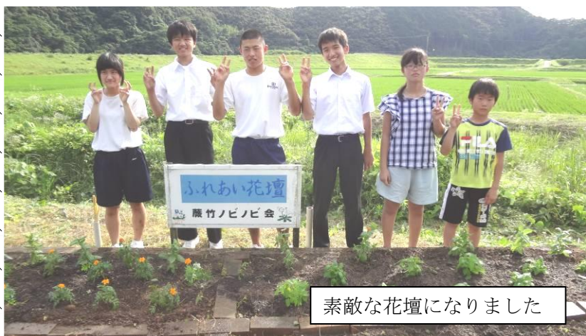
素敵な花壇になりました