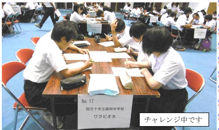
チャレンジ中です