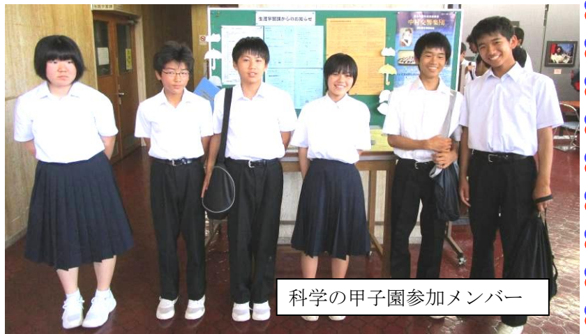
科学の甲子園参加メンバー