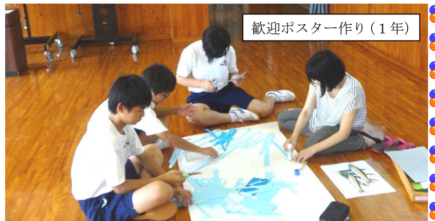
歓迎ポスター作り(1年)