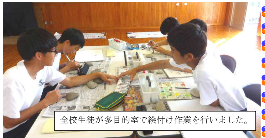
全校生徒が多目的室で絵付け作業を行いました。

また、次回の土曜授業は、改めてご案内はしますが、11月26日(土)に「人権参観日」として実施し、全学年の人権公開授業等を予定しています。