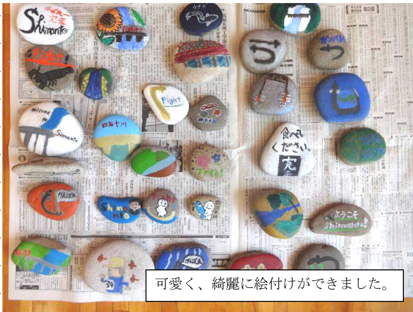
可愛く、綺麗に絵付けができました。