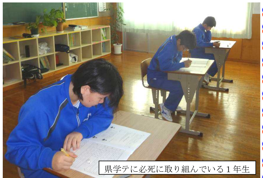
県学テに必死に取り組んでいる1年生

3年生は、高校入試に向けて最後の実力テストとなりました。平均点は前回より若干上昇していますが、個々の結果にはまだまだ課題があるように感じました。しかし、 入試は3月4日、5日で、今日を含めると43日あります。 やる気になって取り組みれば、いくらでも力を蓄えることができます。目標とする高校へ進学できるような学校としても、日々の授業の充実、放課後の補習、朝トレ(朝の進学補習)、面接練習等を行い、できる限りの支援を行っていきたいと思います。家庭でのご支援もよろしくお願いいたします。生徒、学校、家庭が3人4脚で取り組んでいきましょう。