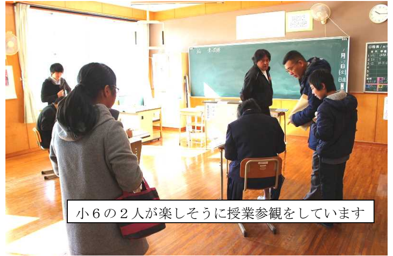
小6の2人が楽しそうに授業参観をしています