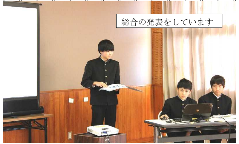
総合の発表をしています

たった数時間の体験入学では中学校のことを知るには十分ではなく、まだまだ不安もあるとは思いますが、この日も小学生のために、精一杯の準備やお世話をしてくれた素晴らしい先輩が中学校にはいます。4月7日には安心して、夢と希望をいっぱい持って入学式に来てもらいたいと思います。