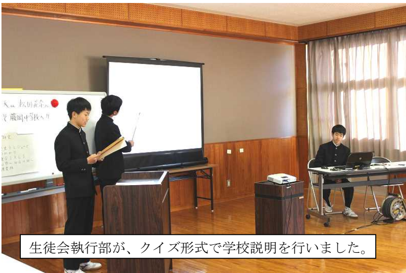
生徒会執行部が、クイズ形式で学校説明を行いました。