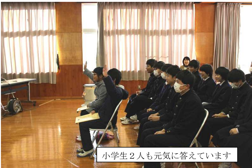
小学生2人も元気に答えています