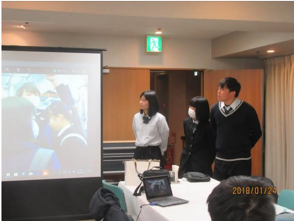
夜の自主研修での各グループによる発表会の様子。