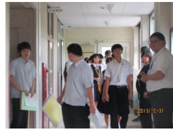
3年生が中心となって中学生を連れて授業参観を行いました。