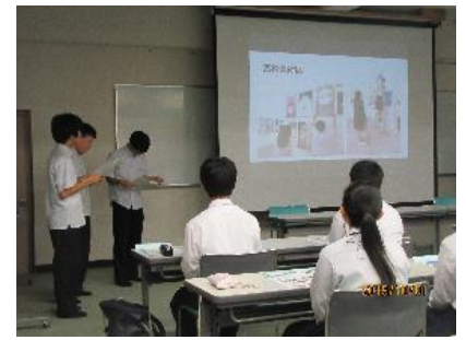
生徒会による高校生活の説明と中学生からの質問に対するアンサー