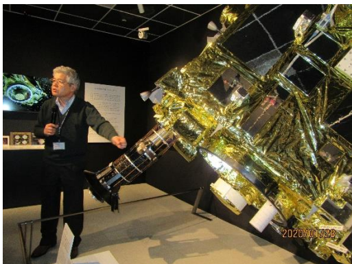
熱心に解説して いただきました。 これははやぶさ2 の実寸大の模型で す。