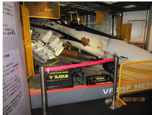
未来体験ツアー 3Dの 映像を見ました。