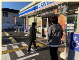
【舎外活動の様子】 (コンビニへ買い物)