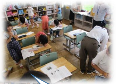
友達のいい所を探してワークシートに記入しています。

尾立しほ…みんながやさしいと思った。自分にもいいところがあると思った。友だちっていいなおもった。