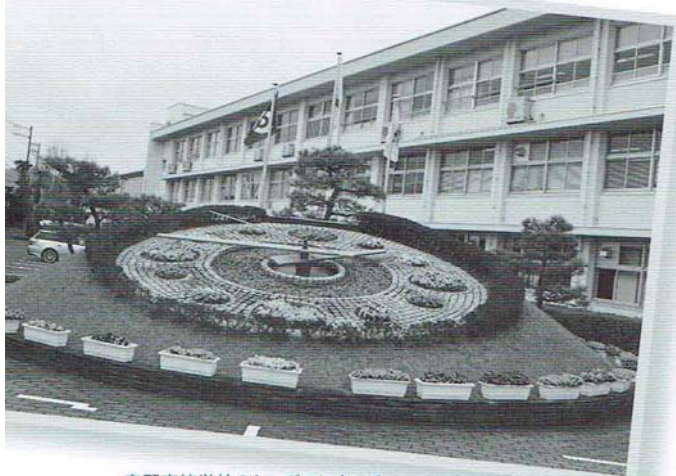
春野高等学校のシンボルになっている花時計