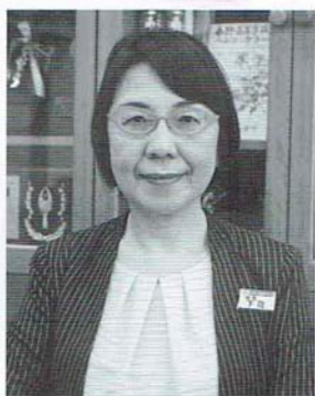
「私たち教職員の指導についてきてくれる素直な生徒がたくさんいるのが、本校の自慢。シンボルの花時計とともに明るく元気に育ってほしい!」(下司眞由美校長)