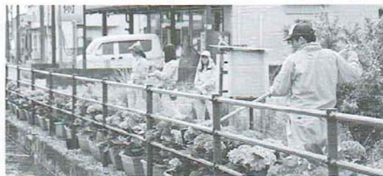
あじさいの手入れをする本校生徒

園芸系列では、学校の正門前の用水路沿いの通称“あじさい街道”の衰退を何とかできないものかと「がっかり街道 再生プロジェクト～あじさいでつなぐ地域の輪～」をテーマに産官学民連携による“あじさい街道”復活を通じた地域コミュニティの活性化に取り組んだ。地元企業から協賛をいただき、子供向け土曜夜市を開催したり、学校前を数十メートルに渡りあじさいのプランターで飾ったりと園芸系列ならではの取組を行い、地域からの期待も大きくなっている。また、この活動を広報するために制作したCMが高知県主催「君のまち動画コンテスト」で優秀賞を受賞することもできた。“あじさい街道”の復活が、地域コミュニティの活性化につながるとの手応えから本年度は後輩が取組を引き継いでいる。