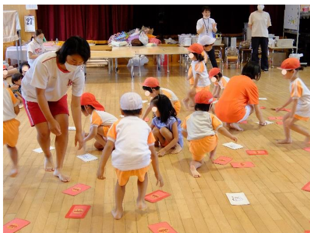
くるみ幼稚園（高知市北竹島）