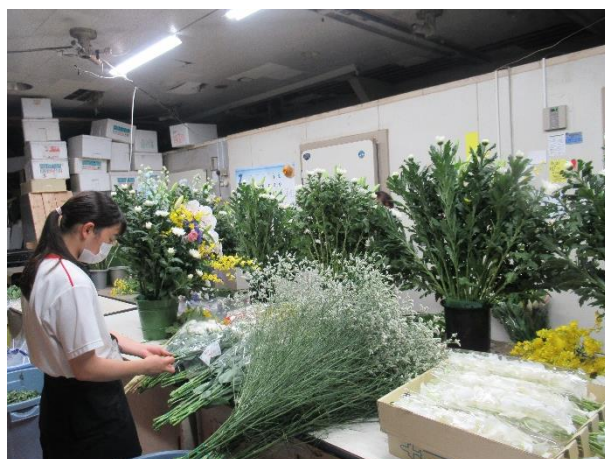
金子生花店（土佐市）