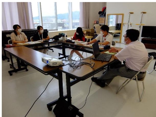
土佐市社会福祉協議会（土佐市）