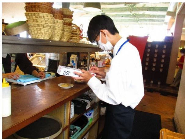
ガーデンレストラン あじさい街道（高知市春野）