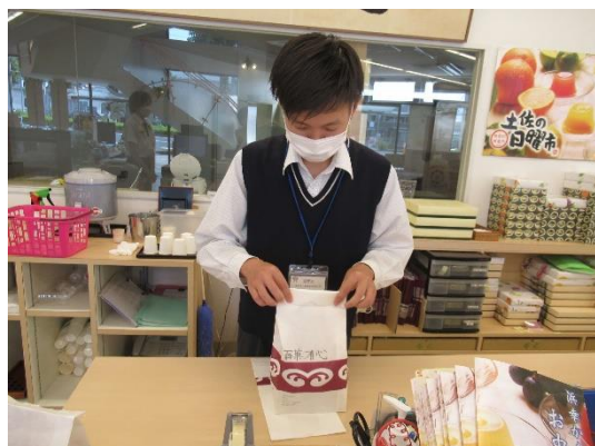
浜幸 土佐道路店（高知市鴨部）