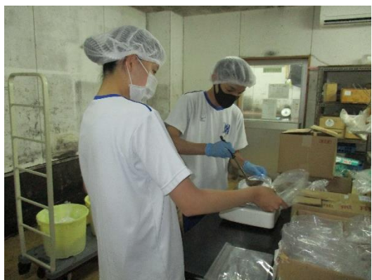
(有)石元食品（高知市春野町）