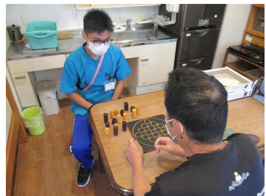
高知ハビリテーリングセンター（高知市春野町）