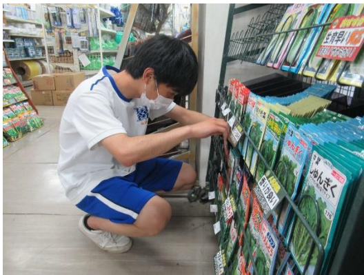
JA土佐市支所（土佐市）