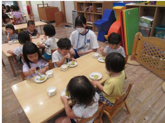
うららか保育園（高知市春野町）