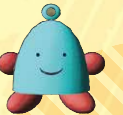
東高認キャラクター「立志くん」