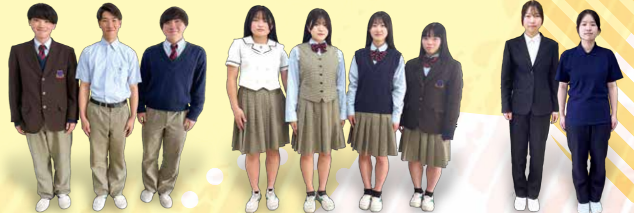
(高校 総合学科・看護学科)