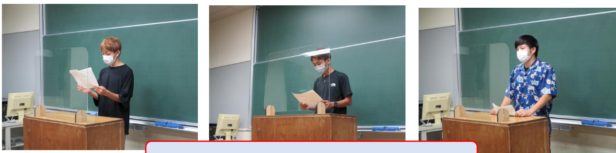
校内生活体験発表会の様子