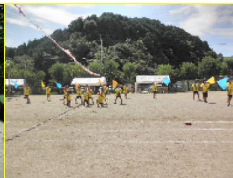
全校ダンス「ミルクムナリ」