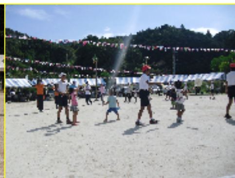
踊り「月夜のポンチャリン」