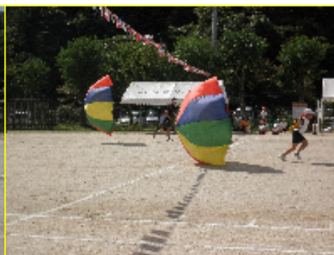
3・4年生親子競技 「空高くゴーゴー」