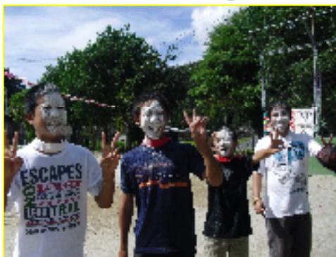
一般「お化粧上手は だれ！」