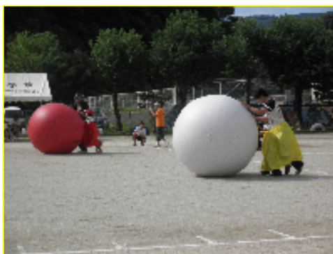
1・2年生親子競技 「パンツでよいしょ」