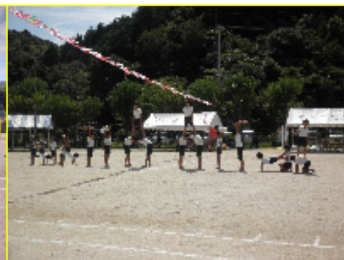
全校種目「ピシツと組体操」