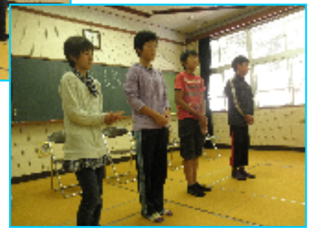
前期児童会役員さん ありがとう