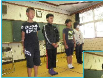
後期児童会役員さん よろしくお願ひします