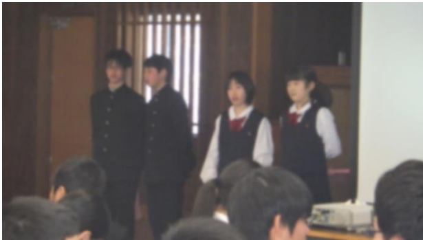
1年A 長崎の魅力を知ろう!