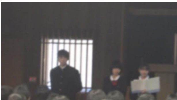
2年A 香美市の英語力向上に向けて