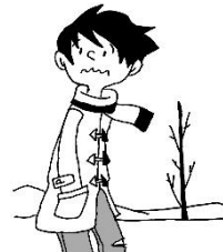
冬来たりなば春遠からじ

昨日は、参観日でした。お忙しい中参観していただいた保護者の皆様、ありがとうございました。授業の様子はいかがだったでしょうか。新学習指導要領にむけて、授業も探求型にしていこうとしています。総合の発表の感想などもお寄せいただくと幸いです。