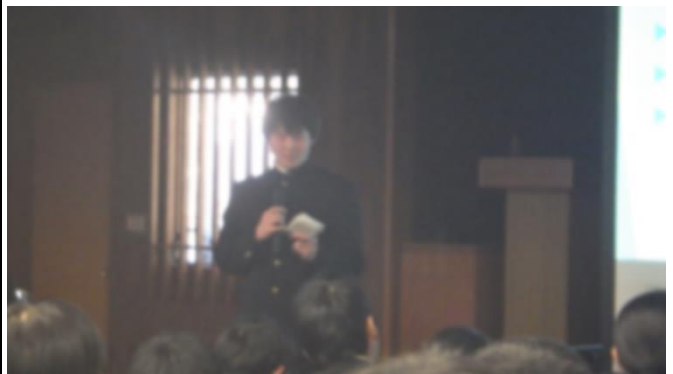
3年B 職場体験学習で学んだこと ～ネットヨタ編～