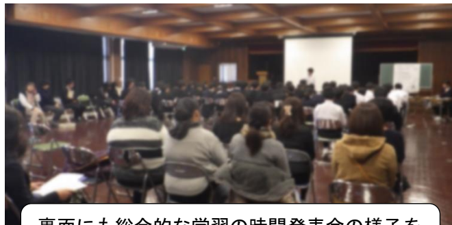
裏面にも総合的な学習の時間発表会の様子を載せています