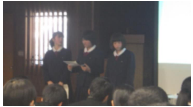
2年B 香美市の人口を増やすために