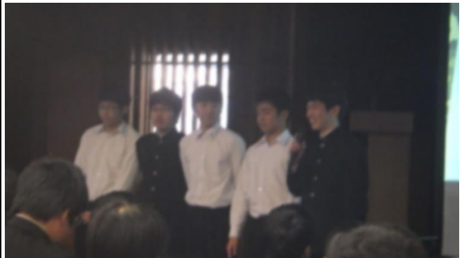
3年A 職場体験学習で学んだこと ～自衛隊編～