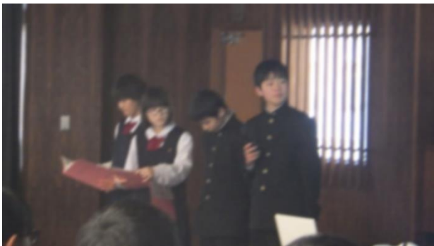
1年B スクープ。長崎の原爆